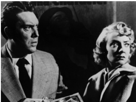
1952 J'AI VÉCU DEUX FOIS (Man in the Dark) de Lew Landers avec Edmond O'Brien