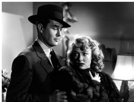
1948 UN PACTE AVEC LE DIABLE (Alias Nick Beal) de John Farrow avec Ray Milland