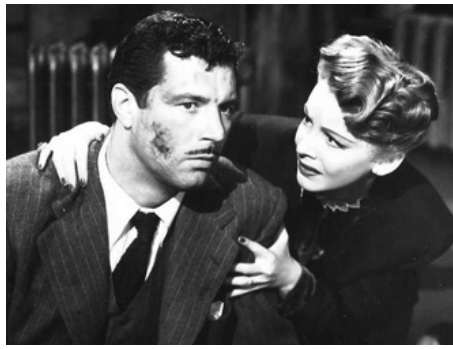
1945 DANGEREUSE ASSOCIATION (Dangerous Partners) d'Edward L. Cahn avec James Craig