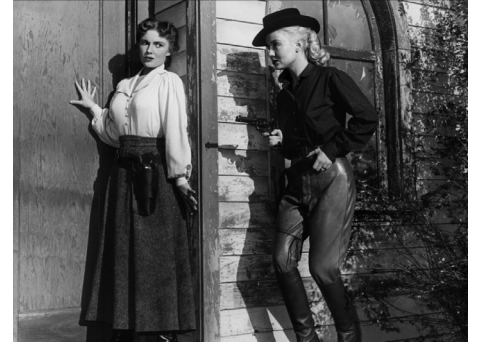
1952 LA FEMME QUI FAILLIT ÊTRE LYNCHÉE (The Woman they almost lynched) d' Allan Dwan avec Joan Leslie