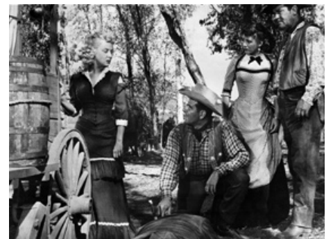
1954 MASSACRE CANYON de Fred F. Sears avec Jeff Donnell, Philip Carey