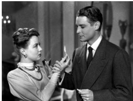
1947 LE CRIME ÉTAIT PRESQUE PARFAIT (The Unsuspected) de Michael Curtiz avec Ted North