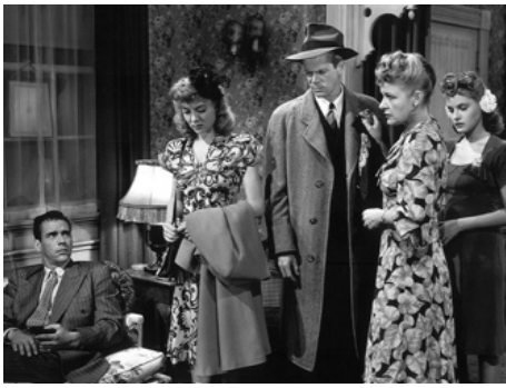
1944 MAIN STREET AFTER DARK d'Edward L. Cahn avec Dan Duryyea, Selena Royle