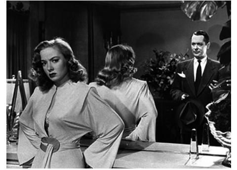
1947 LA DAME DU LAC (Lady in the Lake) de Robert Montgomery avec Robert Montgomery