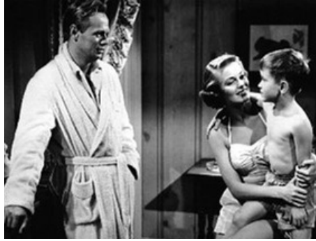
1952 SANS MAMAN (My Pal Gus) de Robert Parrish avec Richard Widmark