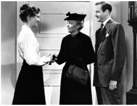
1951 LA FEMME AU VOILE BLEU (The blue Veil) de Curtis Bernhardt avec Jane Wyman, Cyril Cusack