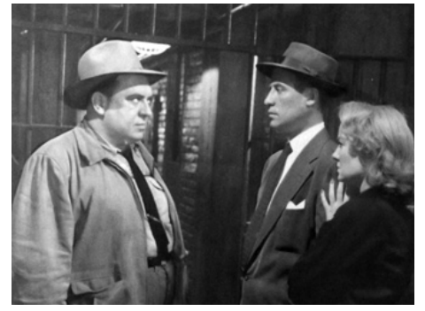
1952 LA CARTE FORCÉE (The Sellout) de Gerald Mayer avec Thomas Gomez, John Hodiak