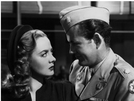
1947 LE COMMENCEMENT DE LA FIN (The Beginning of the End) de Norman Taurog avec Robert Walker