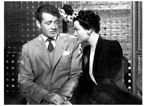
1945 THE SAILOR TAKES A WIFE de Richard Whorf avec Robert Walker