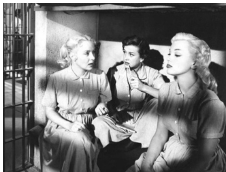
1954 FEMMES EN PRISON (Women's Prison) de Lewis Seiler avec Phyllis Thaxter, Jan Sterling