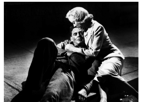
1948 NOUS AVONS GAGNÉ CE SOIR (The Set-up) de Robert Wise avec Robert Ryan