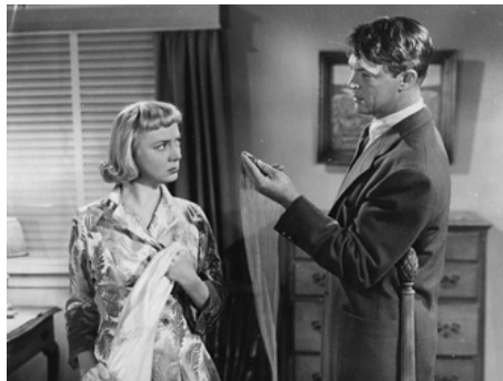
1952 CHAMPION D'UN JOUR (Champ for a Day) de William A. Seiter avec Alex Nicol