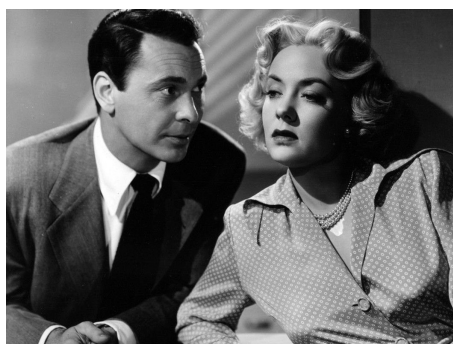
1949 TENSION (Tension) de John Berry avec Barry Sullivan