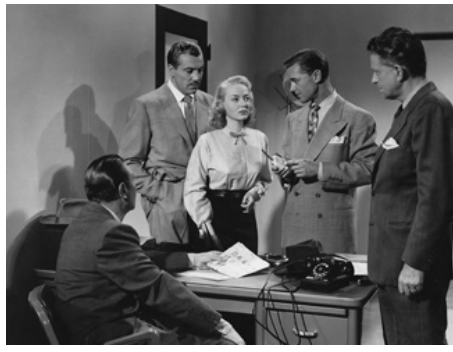
1951 LES FILLES DU CODE SECRET (FBI Girl) de William A. Berke avec Cesar Romero, Tom Drake