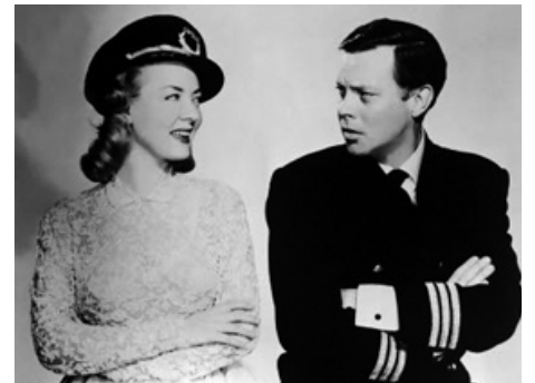
1953 DESCENDONS LE MISSISSIPI (Cruisin' down the River) de Richard Quine avec Dick Haymes