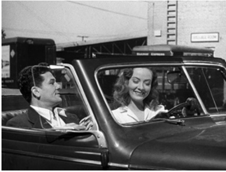
1946 LE FACTEUR SONNE TOUJOURS DEUX FOIS (The Postman always rings twice) de T. Garnett avec J. Garfield