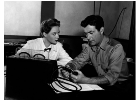
1947 LE MUR DES TÉNÉBRES (High Wall) de Curtis Bernhardt avec Robert Taylor