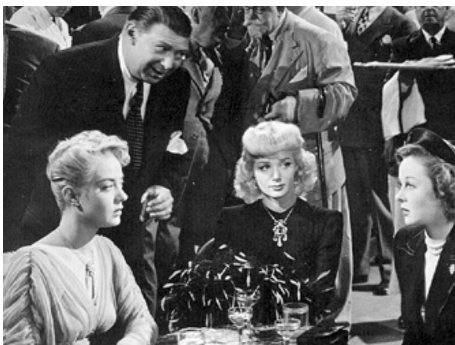
1948 THE SAXON CHARM de Claude Binyon avec Harry von Zell, Cara Williams, Susan Hayward