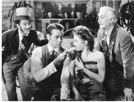
1946 THE COCKEYED MIRACLE de S. Sylvan Simon avec Leon Ames, Keenan Wynn, Frank Morgan