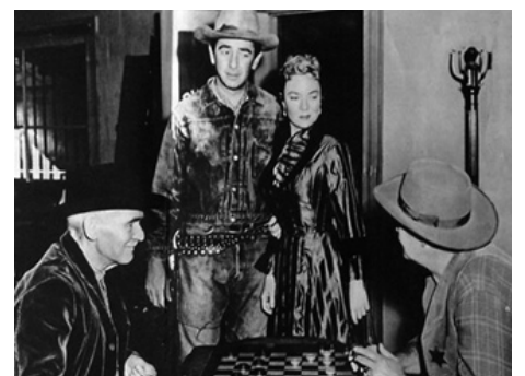
1958 CALIBRE 44 (Man or Gun) d' Albert C. Gannaway avec Macdonald Carey