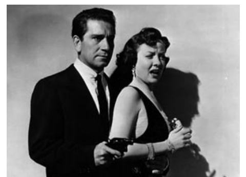
1950 SOUS LA MITRAILLE (Under the Gun) de Ted Tetzlaff avec Richard Conte