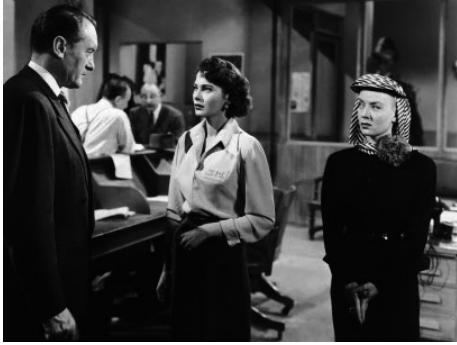
1952 AVEUX SPONTANÉS (Assignment : Paris) de Robert Parrish avec George Sanders, Marta Toren