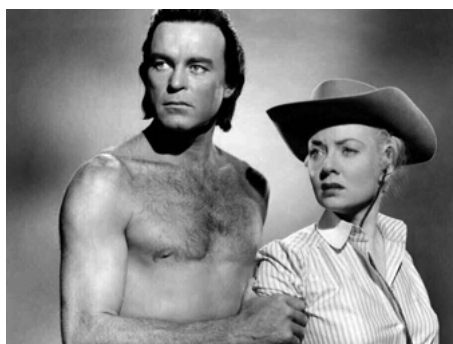
1955 COURAGE INDIEN (The Vanishing American) de Joseph Kane avec Scott Brady