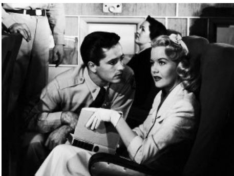
1953 MISSION EN CORÉE (Mission over Korea) de Fred F. Sears avec John Derek